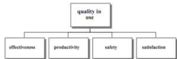
Gambar 3 Karakteristik Kualitas Penggunaan Perangkat Lunak